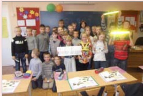
Akcijos „Būk matomas – būsi saugus“ metu antroakai svečiuojasi pas ketvirtokus.

Rugsėjis – saugaus eismo mėnuo. Šia proga rugsėjo 21 d. mokykloje-darželyje vyko akcija „Būk matomas – būsi saugus“. Jos metu antros klasės mokiniai su savo mokytoja, nešini atšvaitais, pirmiausia aplankė savo kaimynus pirmokus ir linksmomis eiliuotais posakiais priminė, kaip svarbu nešioti atšvaitą tamsiu paros metu. Trečiokai ir ketvirtokai savo saugaus eismo žinias galėjo patikrinti „Žaibo“ turnyre. Aktyviausi turnyro dalyviai buvo apdovanoti atšvaitais. Atšvaitai buvo dalijami ir vaikams, kurie jų dar neturėjo. Vėliau salėje visi pradinukai su savo mokytojomis žiūrėjo filmukus „Tamsa“ ir „Saugus elgsys gatvėje“, buvo dalinamos atmintinės, kaip teisingai nešioti atšvaitus. Tikimės, kad mokiniai atšvaitus kiekvieną dieną segės ant kuprinių ir saugosis gatvėje.